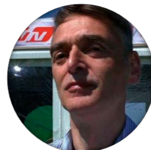
Tekst og foto: Tom Jul Pedersen

M idt i juni løb Folkemødet på Bornholm af stablen for 6. år i træk. Det er uden tvivl blevet en større succes, end man kunne have drømt om i sin tid. De omkring 100.000 gæster lægger da også et par kroner på solskinsøen de 4 dage, det varer. Man forstår godt, de ikke vil af med det arrangement. Det er 5. år LAP er med; i sin tid startede vi uden telt eller anden platform, vi kunne promote foreningen fra. Arbejdet bestod i at kontakte politikere samt andre magtpersoner, i et håb om at vores politiske budskab kunne komme frem. Vi skulle skabe et netværk, som det hedder på nudansk.